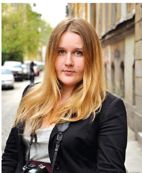
Екатерина Ковалева, фотограф

Поздравляю наших дорогих ветеранов с Великим праздником — Днем Победы! К сожалению, вас осталось не так много. И с каждым годом становится все меньше. Поэтому я желаю вам крепкого здоровья и хорошего настроения. Пусть вас всегда радуют ваши внуки, дети, родные. Еще хотелось бы отметить, что в последнее время мы расстраиваем наших ветеранов тем, что забываем их заслуги перед Родиной. Давайте помнить! Вечно.