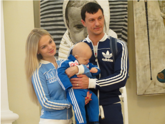
Мама, папа, я – спортивная семья