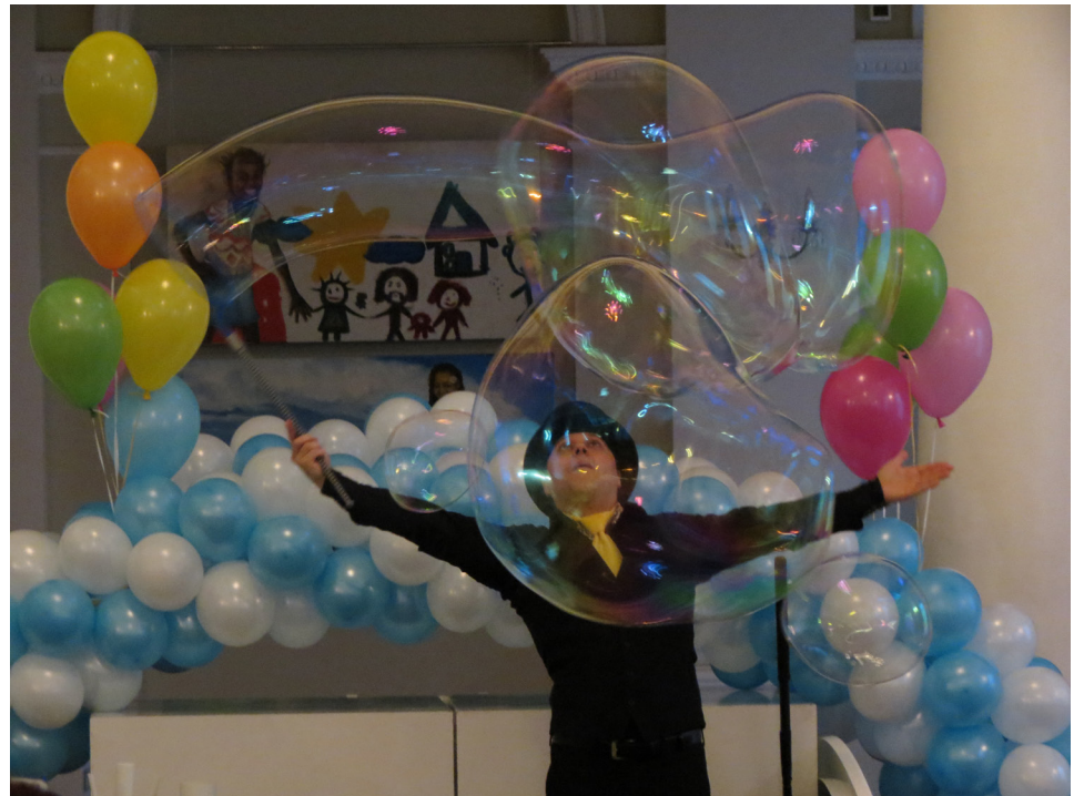
Властелин мыльных пузырей собственной персоной