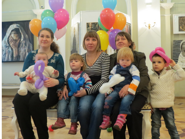
Большая семья – счастливая семья