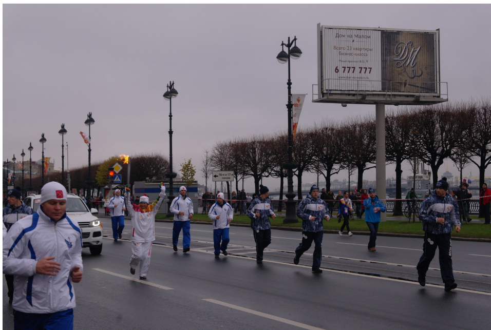
Олимпиада – это общероссийский праздник. Оставила она свой след и на Васильевском острове Санкт-Петербурга.

Олимпийский огонь в Муниципальном образовании №7