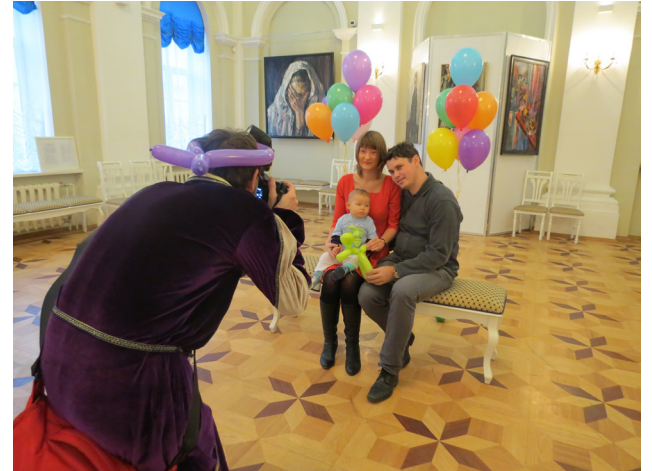
Малыши и их родители под пристальным взглядом папа-раци