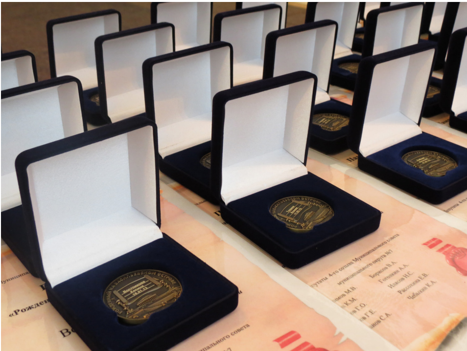
Медали ждут своих героев