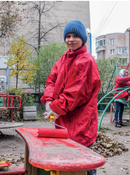
Самый юный участник субботника.