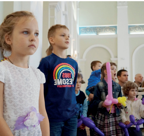
— А что это такое интересное?