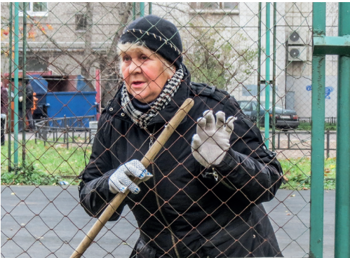
Добровольное участие, говорите?