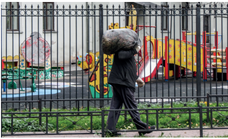
...а другие их уносят.