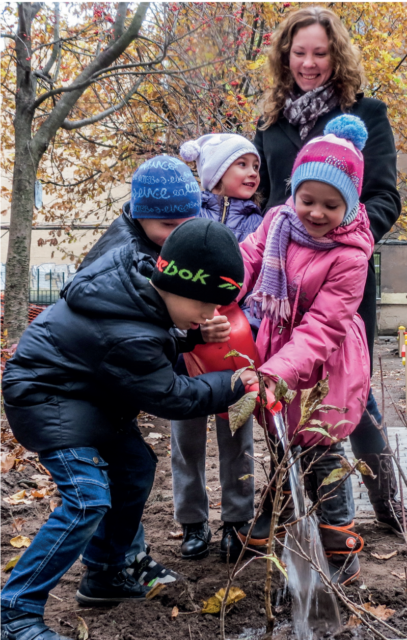
Очень важно — обильно полить куст сирени. Тогда он лучше приживется и на следующий год порадует садоводов свежими листочками