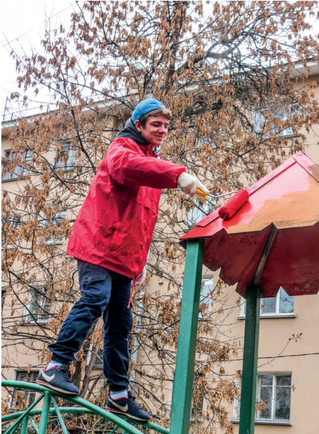
Чем выше стоишь, тем меньше краски накапает сверху.