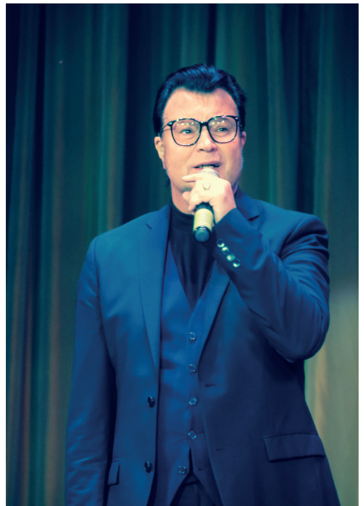
Звезда концерта — Юрий Охочинский.

«Прекрасный концерт. Очень благодарна организаторам и артистам. Они своим добрым отношением к нам, старикам, придают нам силы. Мы чувствуем заботу и