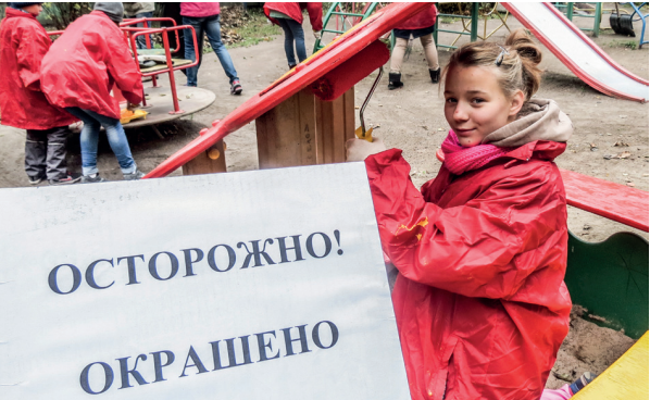
Красить и не испачкаться - перевод краски!

В муниципальном округе №7 22 октября прошел субботник. Убирались везде - на Большом проспекте Васильевского острова, на линиях и во дворах. Муниципалы звали всех желающих помочь во дворе дома №18 по 17-й линии и во дворе рядом с Социальным центром «Радуга». Желающих собралось много. У «Радуги» в основном трудились ветераны. Они убирали листву под зажигательные хиты прошлого. На 17-й линии работали ребята из детского подросткового клуба. Они красили детскую площадку.