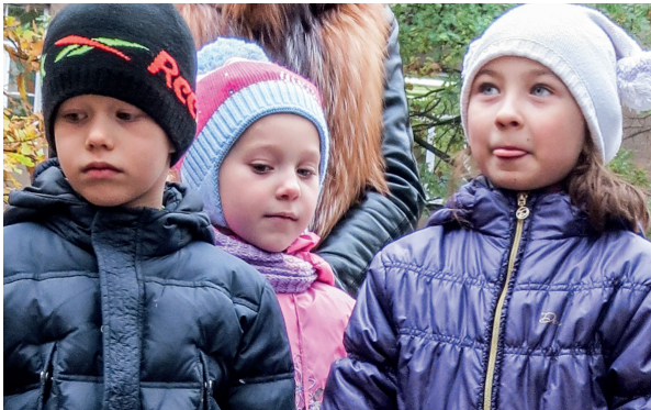
А никто не говорил, что будет просто. Можно и язык от усердия высунуть...