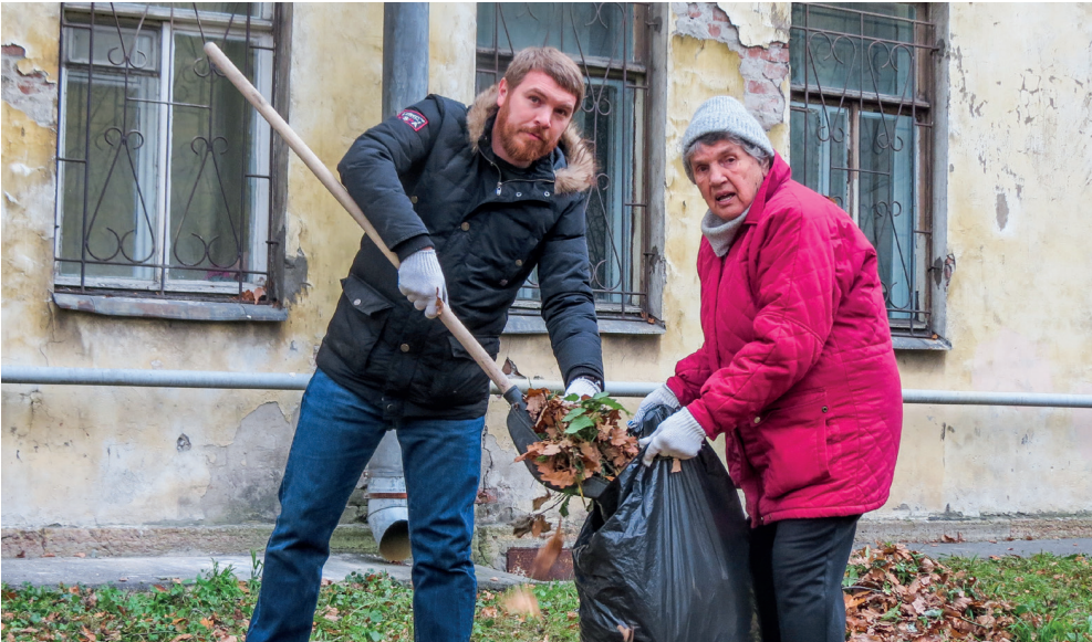
Командная работа, это когда одни пакеты листьями заполняют...