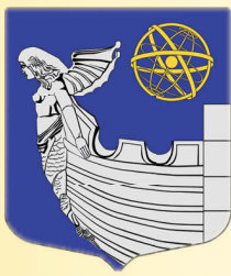
Местная администрация и депутаты Муниципального совета МО МО №7