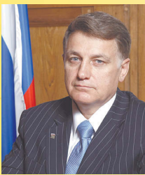
Председатель Законодательного собрания Санкт-Петербурга Вячеслав Макаров