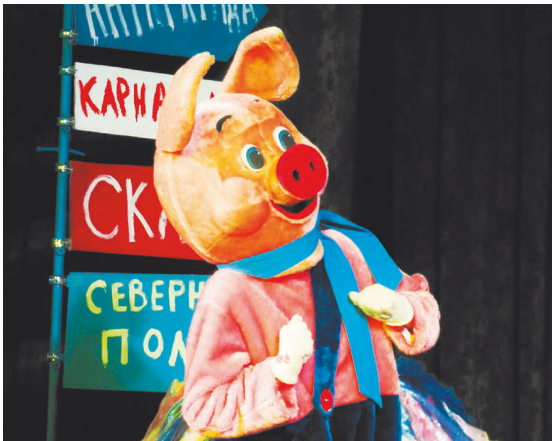
Символ 2019 года — свинья. Говорят, что в украшении дома должны присутствовать хрюшки. Тогда удача обеспечена. Но также отдать дань уважения свинье можно, устроив легкий творческий беспорядок.