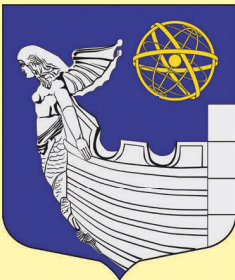
Местная администрация и депутаты Муниципального совета МО МО №7