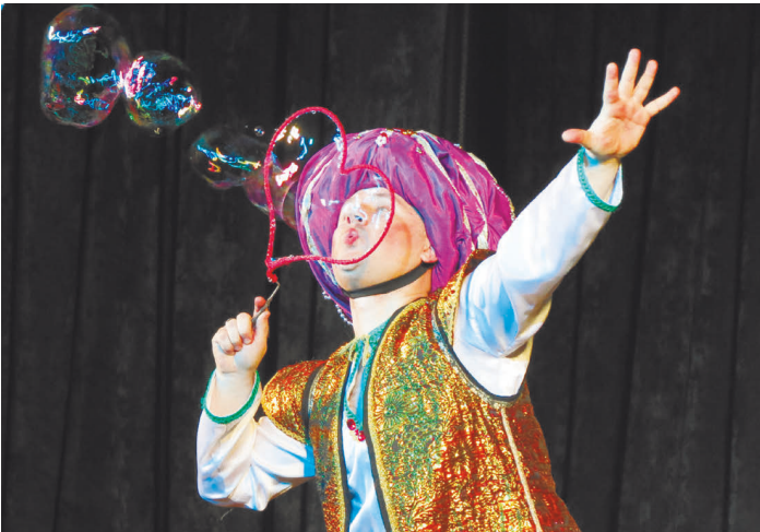
Заклинатель из Индии больше всего понравился детям. Они встали со своих мест, подбежали к сцене и со смехом подпрыгивали, пытаясь поймать мыльные пузыри. Но те лопались у них над головами, разлетаясь на блестящие в свете софитов брызги.