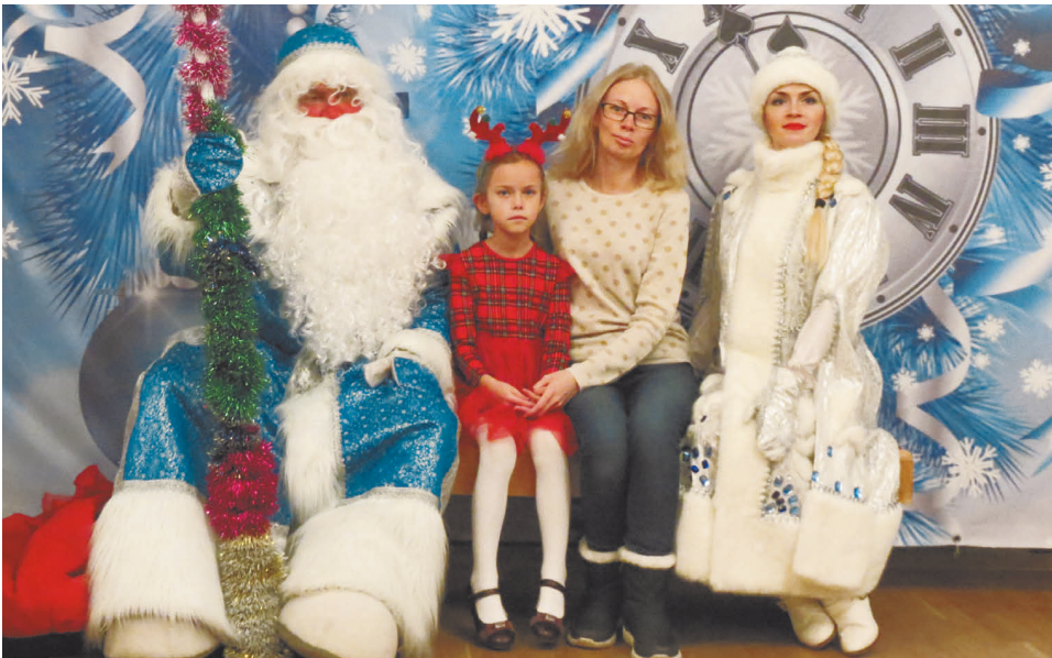
На новогодней елке гостей встречали Дед Мороз и Снегурочка. Они фотографировались с детьми и их родителями. После праздника на память гостям вручили снимки. Впрочем, сфотографироваться можно было не только с Дедом Морозом и Снегурочкой, но и с другими сказочными героями.

Детишки постарше на другом представлении смогли совершить кругосветное путешествие. Оказалось, что роботы с планеты, где нет Нового года, разбили волшебные часы и разбросали осколки по всему миру. Чтобы найти их, ребята «слетали» в Китай, Индию, Италию и Японию. Интересно, что для детей подготовили не просто спектакли. Номера показывали настоящие цирковые артисты — фокусники, жонглеры, акробаты и заклинатели мыльных пузырей. Акробат на одноколесном велосипеде катал на спине детей и... их мам. Вот они, занимая место в зале, точно не ожидали подвоха. Но не тут-то было. Ассистент выбирал добровольца, провожал его на сцену. Акробат просил закрыть глаза, расставить ноги пошире и, присев, усаживал везунчика к себе на шею. И скажем, мамы радостно визжали куда громче своих смелых детей! В конце представления депутаты муниципального образования вручали каждому гостю подарок — коробку с шоколадными конфетами. Но коробку не простую, а в форме сказочного замка. Технология дополненной