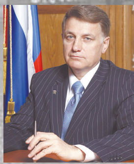
Председатель Законодательного собрания Санкт-Петербурга В.С. Макаров