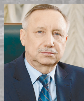
Временно-исполняющий обязанности губернатора Санкт-Петербурга А.Д. Беглов