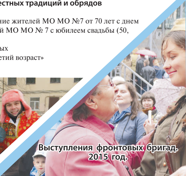
Выступления фронтовых бригад. 2015 год.