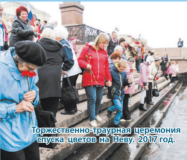
Торжественно-траурная церемония спуска цветов на Неву. 2017 год.