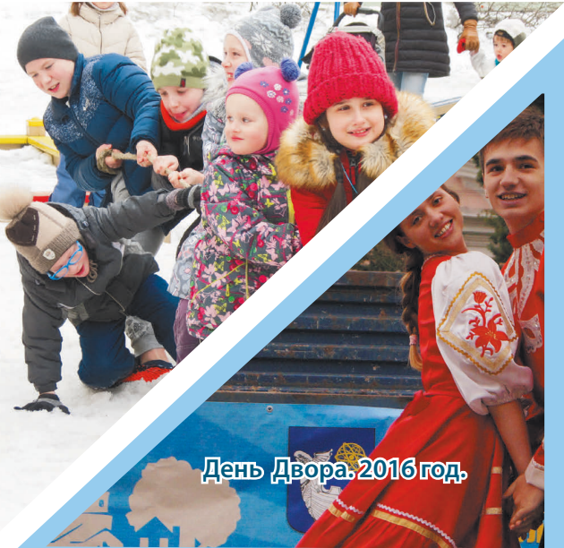
День Двора. 2016 год.