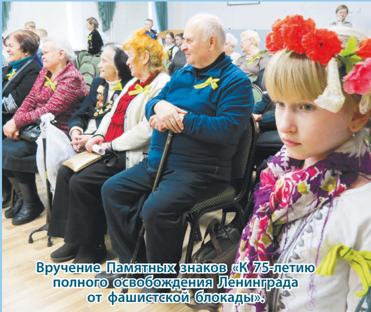
Вручение Памятных знаков «К 75-летию полного освобождения Ленинграда от фашистской блокады».