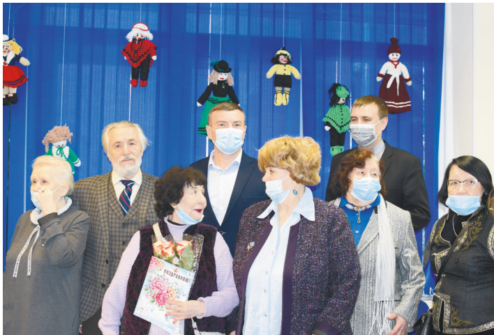
Открытие выставки кукол ручной работы

В Юношеской библиотеке имени Николая Островского придумали очень интересный проект под названием «ИЗОляция». Главная его цель — показать, что даже в сложное время, в условиях новой коронавирусной инфекции, можно радоваться жизни и создавать нечто прекрасное.