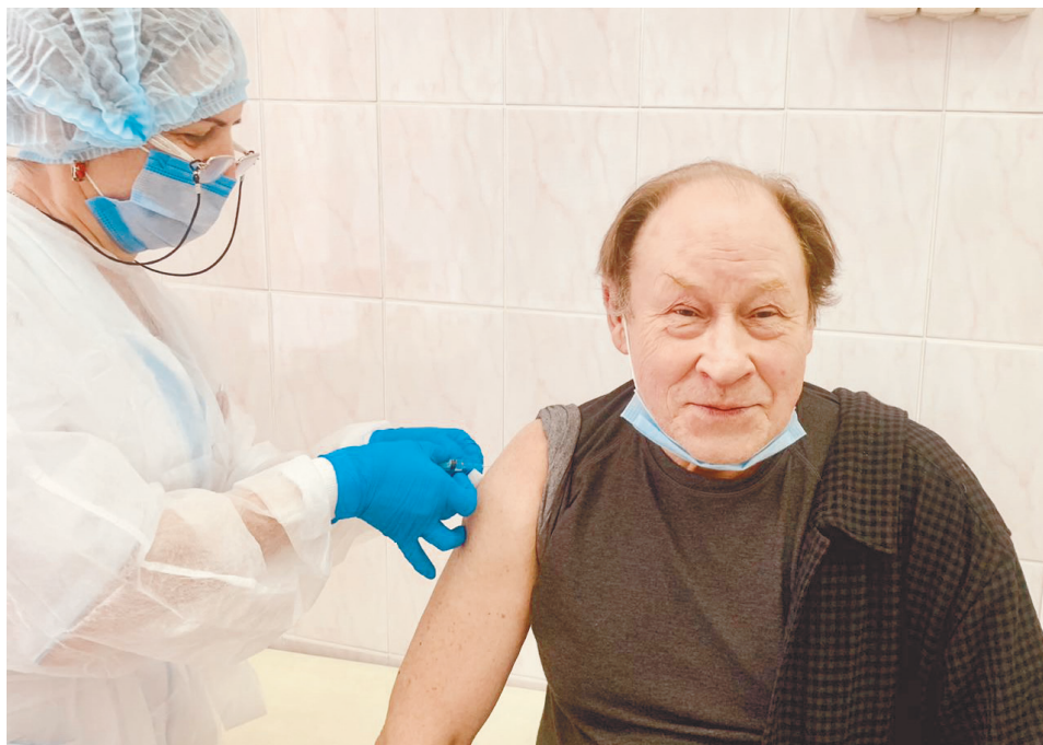
Народный артист Российской Федерации Юрий Леонидович Ицков на вакцинации в Городской поликлинике № 4

После вакцинации в первые-вторые сутки могут развиваться и разрешаются в течение двух-трех последующих дней кратковременные общие (непродолжительный гриппоподобный синдром, характеризующийся ознобом, повышением температуры тела, артралгией, миалгией, астенией, общим недомоганием, головной болью) и местные (болезненность в месте инъекции,