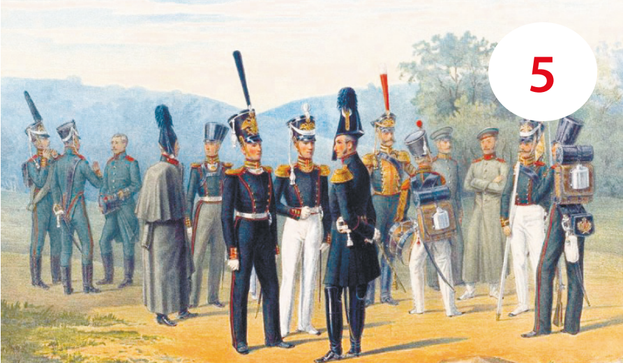
Жительница нашего округа рассказала, почему на карте Васильевского острова так часто встречается слово «финляндский». Оказывается, здесь базировался Императорский лейб-гвардии Финляндский полк.