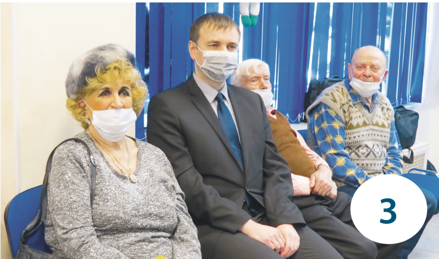
Юношеская библиотека имени Николая Островского показывает работы жителей Васильевского острова. Самоизоляция прошла не даром. Красивых картин и вязаных кукол ручной работы в мире стало больше!