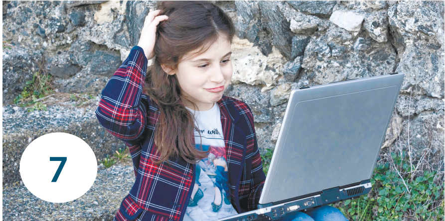
Интернет и дети — опасное сочетание. С одной стороны, во всемирной паутине можно узнать много нового и полезного. С другой стороны, и опасностей там немало. О том, как их избежать, читайте в нашей статье.