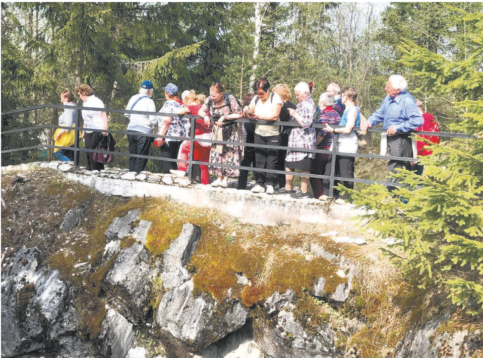
Экскурсия в Рускеалу — это одновременно и отдых, и тренировка. Гулять по живописным тропам хочется бесконечно.