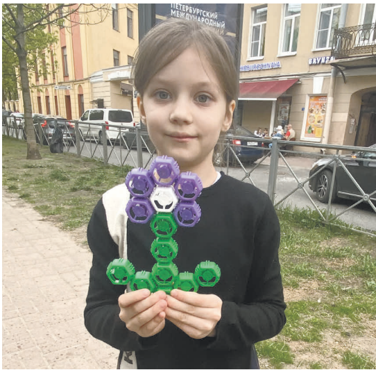
Там, где «Крышечки ДоброТЫ», всегда улыбки и хорошее настроение.

А в «Радуге» решили открыть пункт сбора крышек! Так что туда теперь можно приносить чистые пластиковые крышечки.