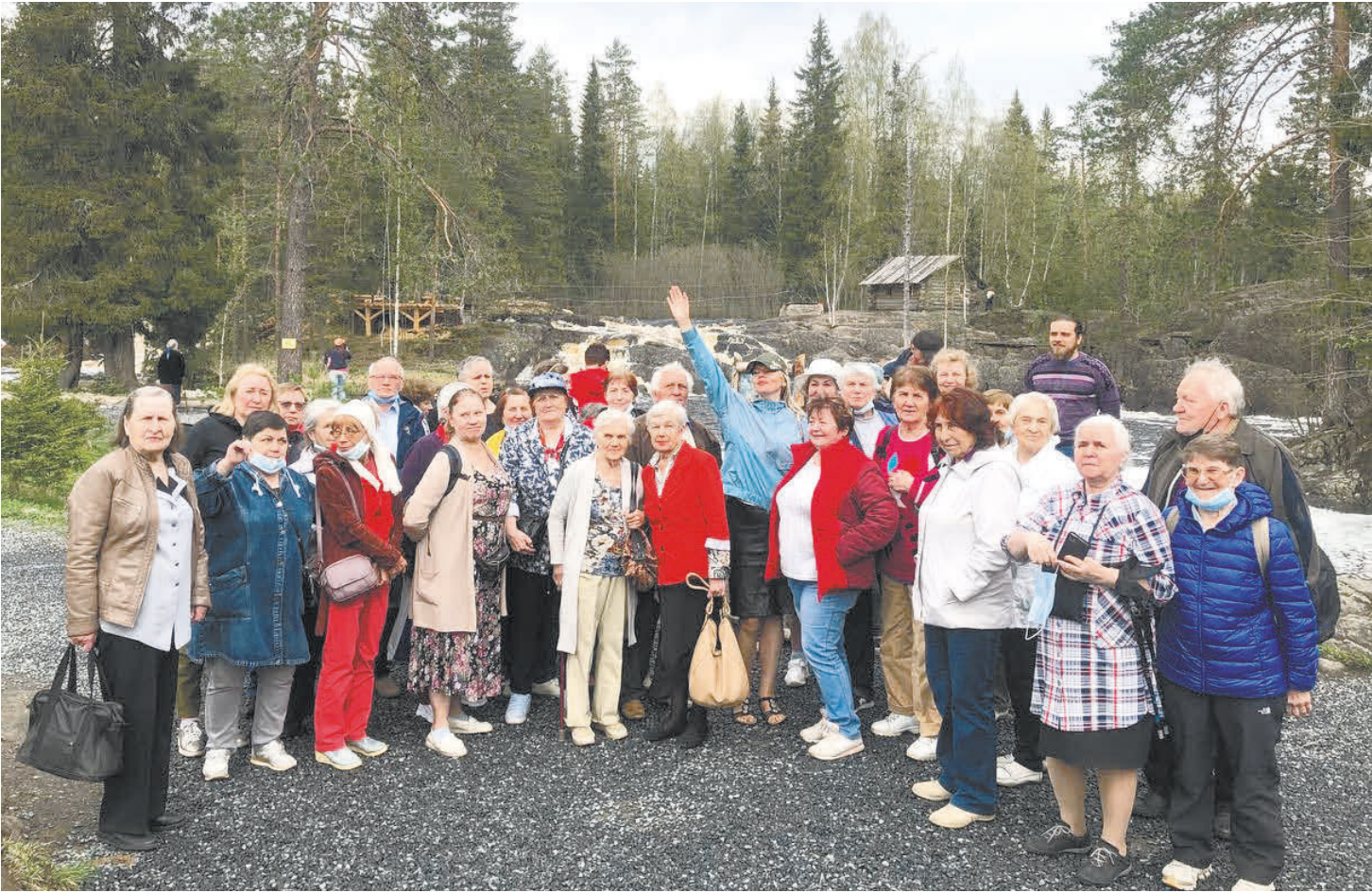
Дружная команда путешественников из муниципального округа № 7.

На месторождении было заложено пять карьеров, на которых с помощью бурения и закладки пороховых зарядов добывался мрамор четырех цветов: пепельно-серого,