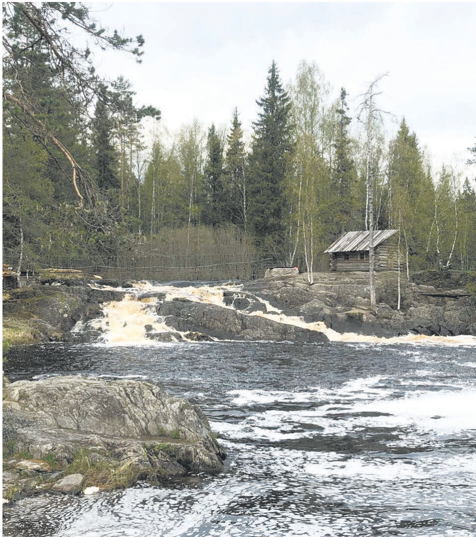
Природа Карелии не уступает по красоте зарубежным достопримечательностям.

Несмотря на объективные трудности, все остались довольны поездкой.