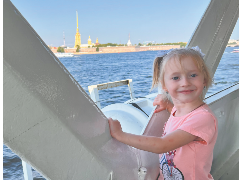
У василеостровцев любовь к кораблям просыпается в самом раннем возрасте. Пассажиры теплохода «Москва» подтвердили это своими довольными личиками.