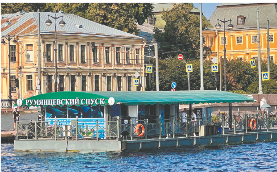
Экскурсии начинаются и заканчиваются в одном и том же месте — у причала «Румянцевский спуск» напротив любимого всеми василеостровцами Румянцевском сада.