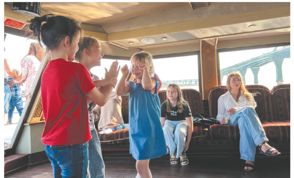
Впрочем, через два часа пути и познавательнейшей экскурсии дети решили, что пора придумать для теплохода новое назначение. На время он стал площадкой для веселых игр.