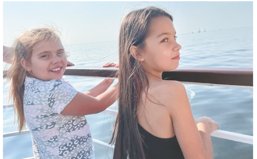
Кто-то все время путешествия провел в каюте, а кто-то на палубе, на самом носу теплохода, глядя в речную гладь. Вдруг из-за горизонта появится корабль с алыми парусами?