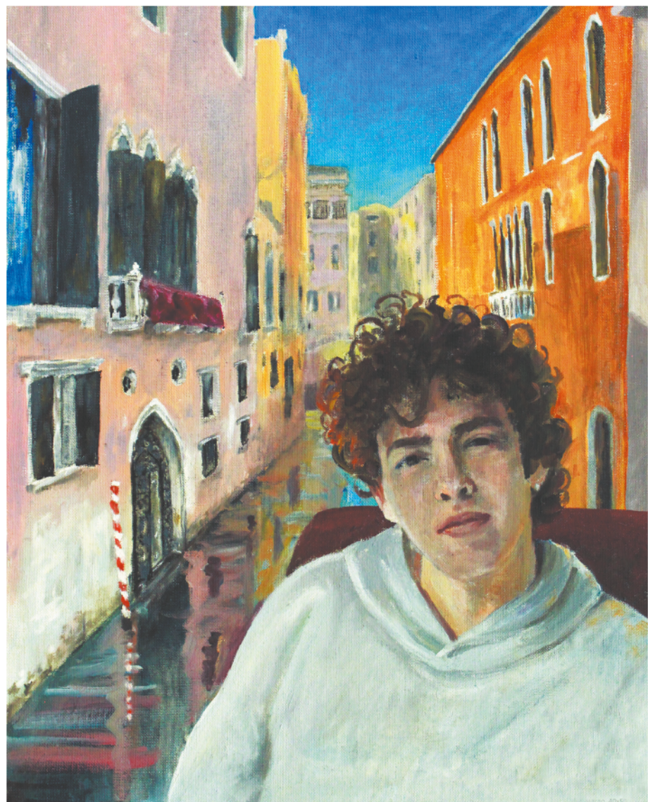
А вот и готовая картина — «Венеция»