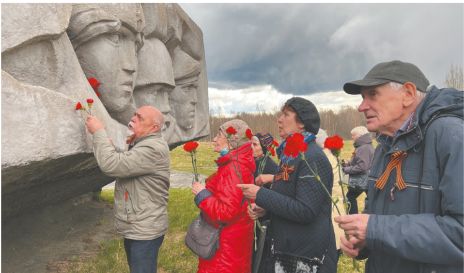
Вспоминая защитников Ленинграда

Ежегодно жители муниципального образования муниципальный округ № 7 приезжают к мемориалу «Лемболовская твердыня», чтобы вспомнить подвиг защитников Ленинграда. Да не где-нибудь, а в особом месте — месте, созданном трудящимися Василеостровского района.