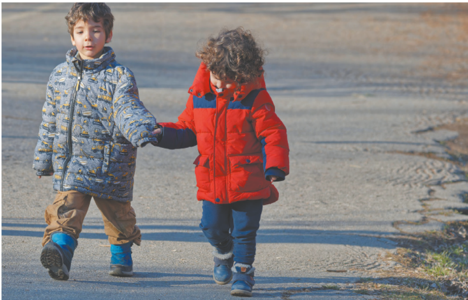
Служба пропаганды БДД ОГИБДД УМВД России по Василеостровскому району г. Санкт-Петербурга

Личный состав и руководство отдела ГИБДД УМВД России по Василеостровскому району г. СПб проводят профилактические беседы с юными участниками дорожного движения и их родителями о важности соблюдения ПДД, ведь от точного соблюдения этих правил зависит здоровье и даже жизнь каждого из нас.