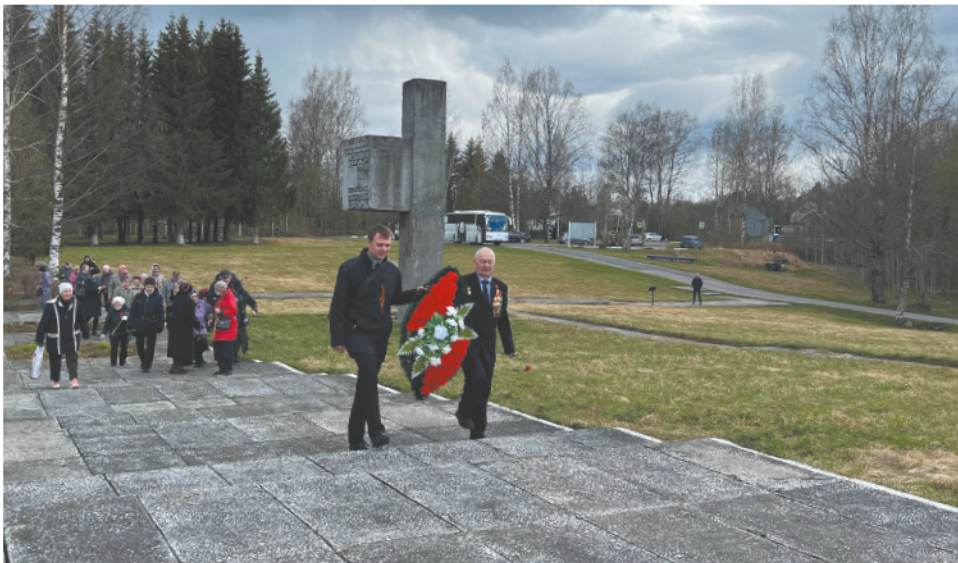
Жители МО МО № 7 покоряют Лемболовскую высоту.

В годы Великой Отечественной войны жители осажденного Ленинграда каждый день слушали сводки с боевых полей. Как далеко продвинулась захватническая армия, какой город завоевала, какие потери понесли советские войска. А потом — в каком сражении выиграли мы, на сколько километров оттеснили врага, какой город освободили. Каждый день жители осажденного Ленинграда мысленно благодарили его защитников, сражавшихся не на жизнь, а на смерть. И даже много лет спустя — жители не забыли о подвиге солдат. В 1967 году на северном берегу реки Муратовки, где в 1941 году части 23-й армии остановили наступление финских войск, трудящиеся Василеостровского района соорудили мемориал и назвали его «Лемболовская твердыня».