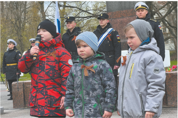
Дети прочли трогательное стихотворение о войне.