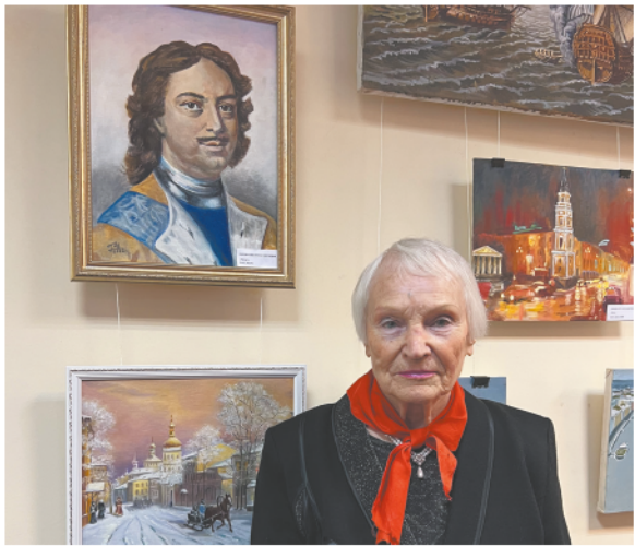
Выставка в честь Петра