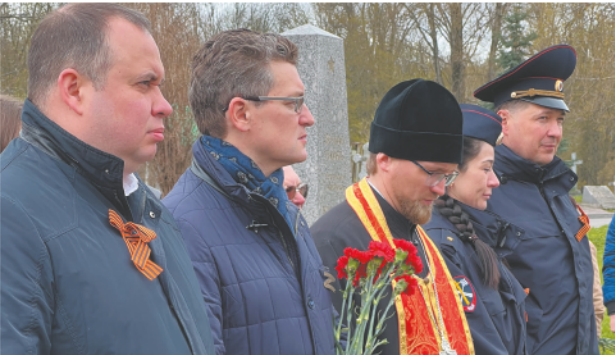
Есть время для активных действий, а есть — для молчаливых раздумий.

В годы Великой Отечественной войны погибшие от холода, голода и бомбежек ленинградцы находили свой последний приют в братских могилах Смоленского кладбища. Невозможно сосчитать, сколько людей похоронено здесь, за черной чугунной оградой. Далеко не обо всех есть официальные сведения, не все имена написаны на гранитных камнях. Но в ленинградских семьях помнят о каждом близком и родном человеке, не пережившем блокаду. Эта память передается из поколения в поколение. Поэтому семьи с детьми приходят на Смоленское кладбище не только по праздникам, поэтому здесь всегда есть свежие цветы. Но накануне 9 мая их, конечно, больше, чем обычно.