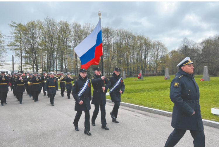
Духовой военный оркестр открыл церемонию.