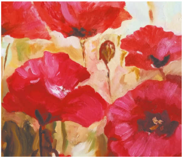
Алые маки Евгении