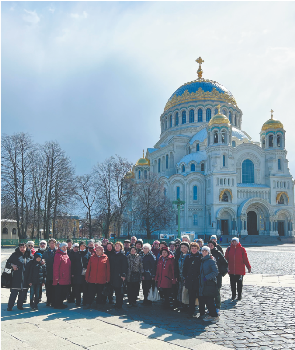
Жители муниципального округа на фоне Морского Никольского собора

Длина дока составляла 2 240 метров. Одновременно в нем можно было ремонтировать до 10 больших кораблей.