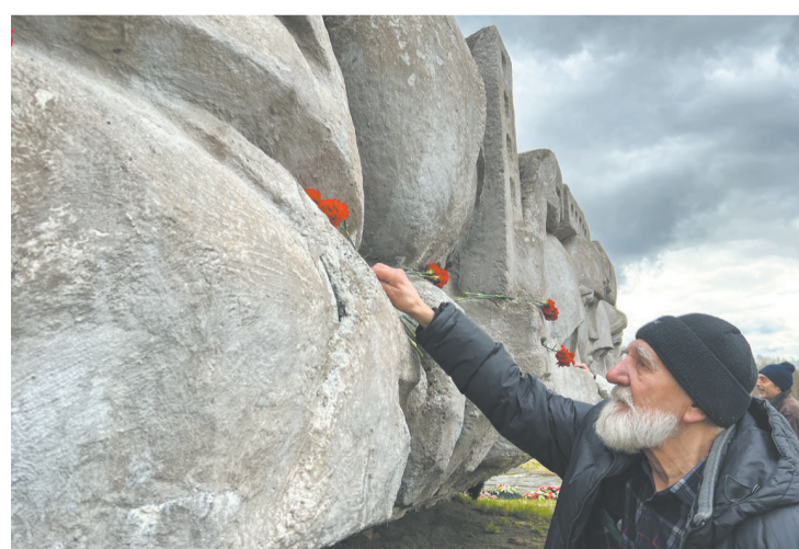
Основные мероприятия мая