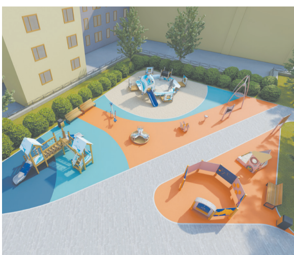
Дорогая сердцу площадка