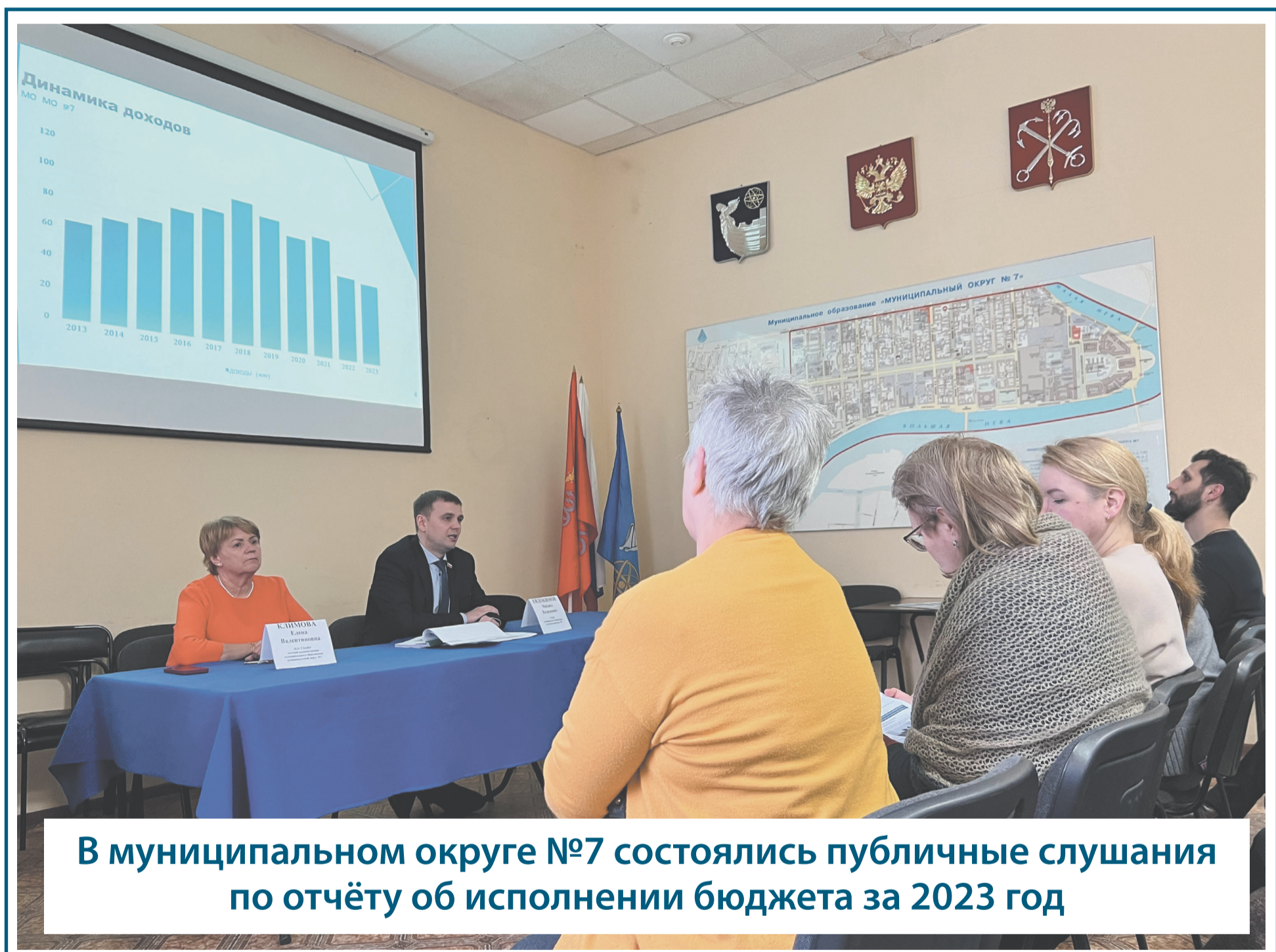
В муниципальном округе №7 состоялись публичные слушания по отчёту об исполнении бюджета за 2023 год

ГАЗЕТА ЖИТЕЛЯ МУНИЦИПАЛЬНОГО ОКРУГА № 7. ВАСИЛЕОСТРОВСКИЙ РАЙОН. САНКТ-ПЕТЕРБУРГ