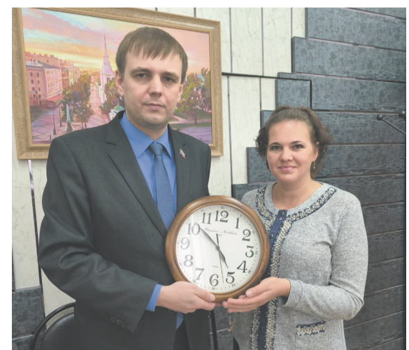
«Меня окружают особенные люди»