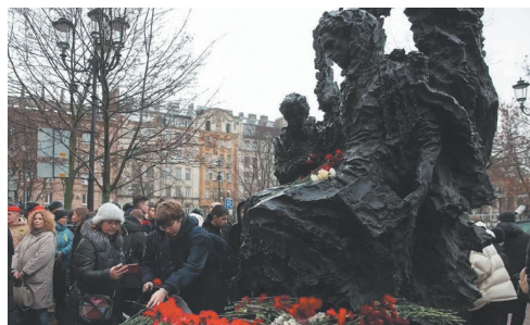
Возложение цветов к памятнику блокадному учителю.