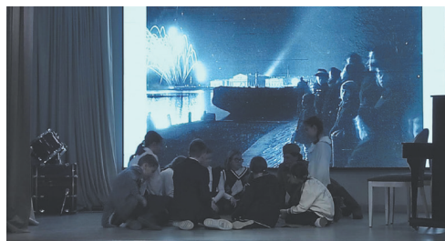
Урок живой истории в Гимназии № 24