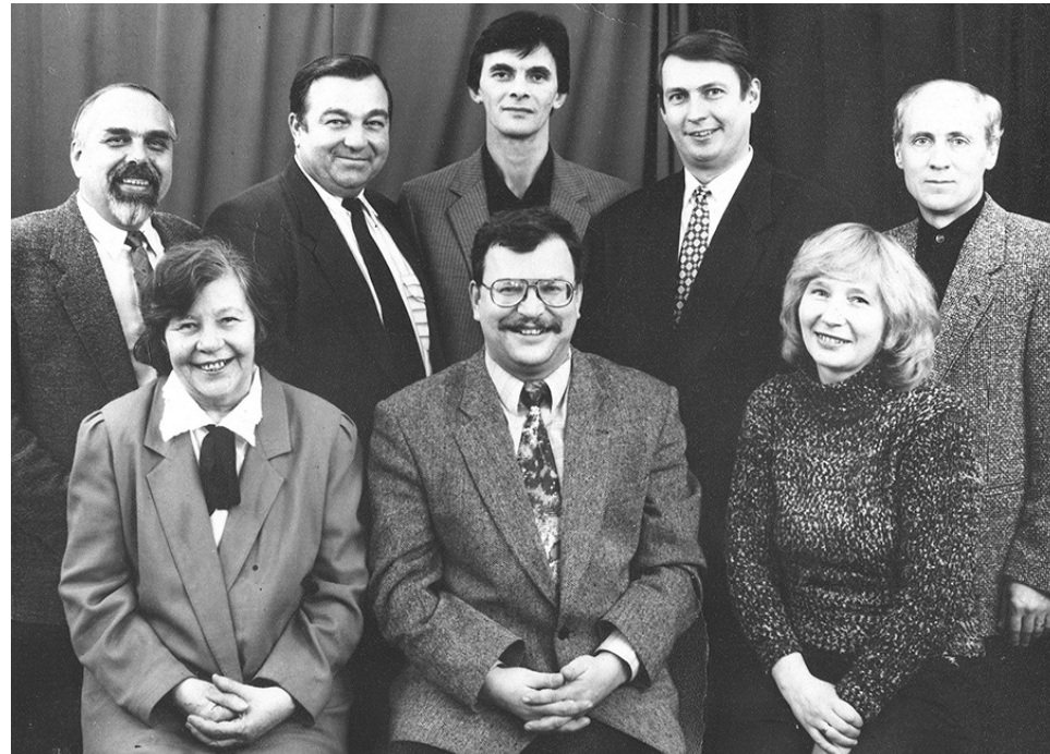
Депутаты первого созыва муниципального образования муниципальный округ № 7.

Продолжилась работа и по благоустройству округа. Как и раньше, в муниципалитете прислушивались к мнению жителей, интересовались, что нужно сделать в первую очередь — где обновить детскую площадку, а где — асфальтное покрытие.