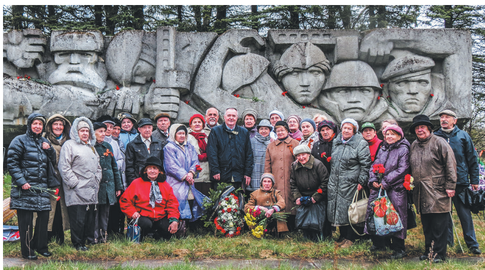
Ежегодная поездка к мемориалу «Лембовская твердыня».