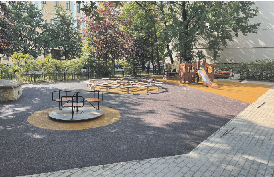
12-я линия В.О., дом 23