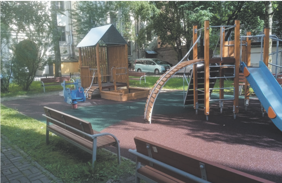
9-я линия В.О., дома 16-18