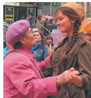
Концерты ко Дню Победы.