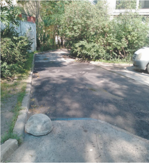
19-я линия В.О., дом 22