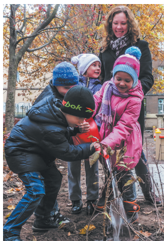
Субботники, участие в которых принимают жители округа.