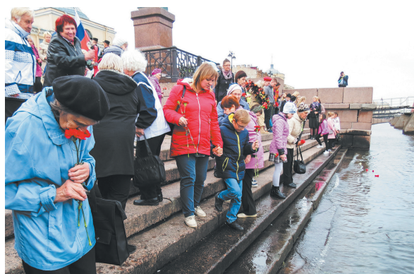
Возложение цветов в память о жертвах блокады Ленинграда.