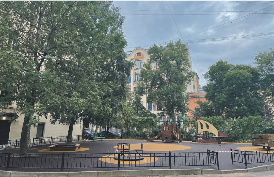
12-я линия В.О., дом 9