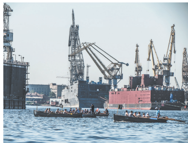
Соревнования по гребле и парусному спорту в акватории Невы.