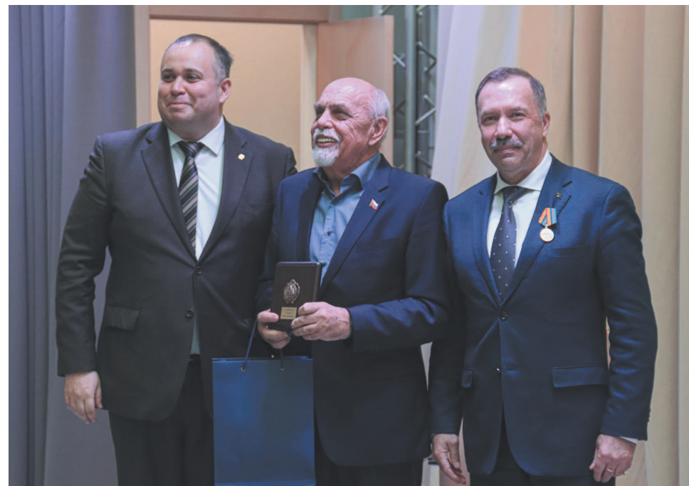
Депутат Законодательного собрания Санкт-Петербурга Константин Чебыкин, заместитель главы муниципального образования муниципальный округ № 7 Сергей Степанов, глава администрации Василеостровского района Санкт-Петербурга Михаил Соболев.