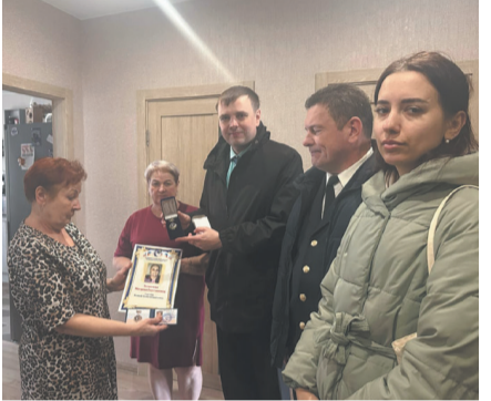
Всего в муниципальном образовании муниципальный округ № 7 вручили девять удостоверений почётных жителей.