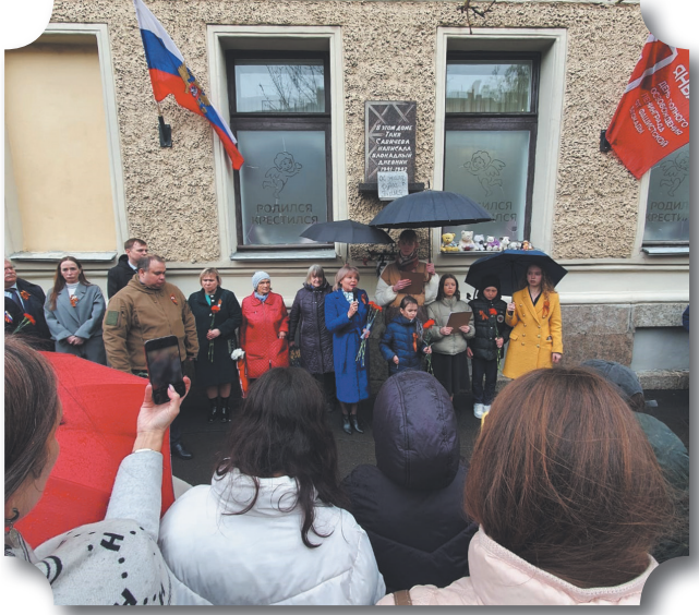
Кадр, который делаем мы